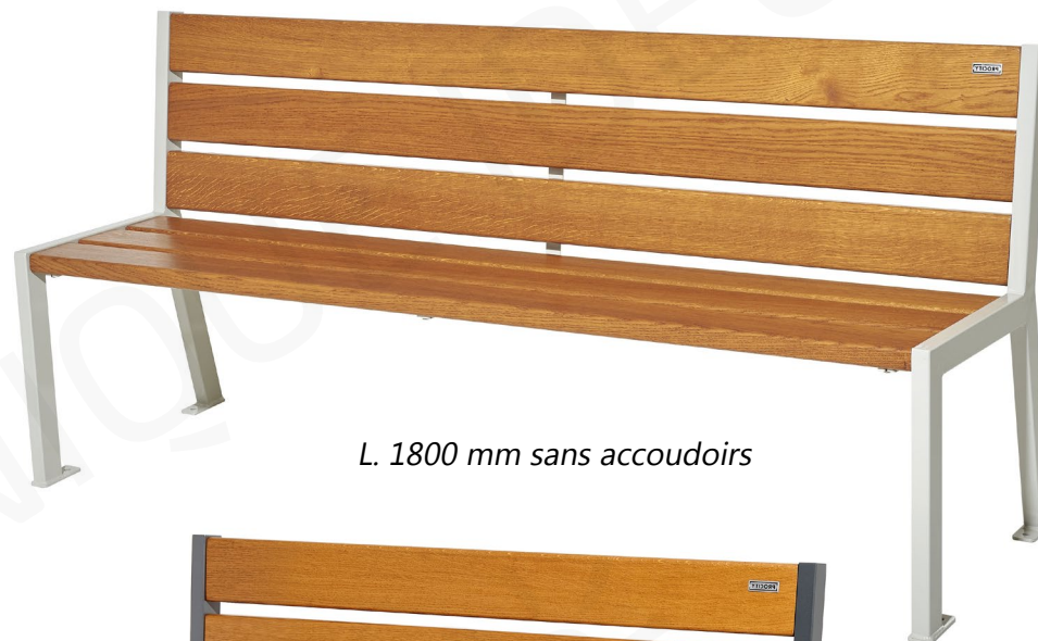
L. 1800 mm sans accoudoirs

FIXATION : sur platines 100 x 40 mm ép. 5 mm, tiges d'ancrage fournies