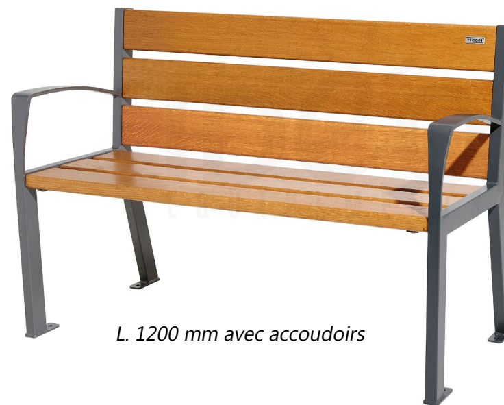
L. 1200 mm avec accoudoirs