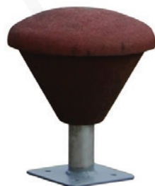
Butoirs en option