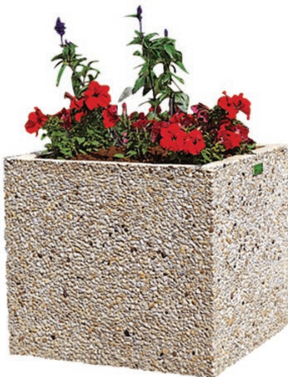
Exemple de réalisation