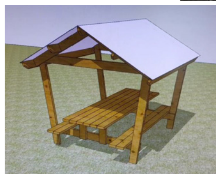
Couverture Aluminium blanc